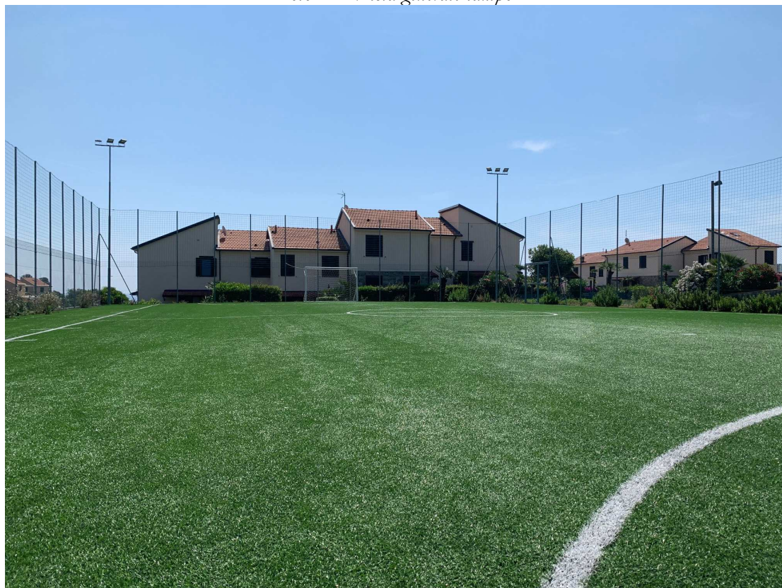
Foto B - Vista dettaglio campo