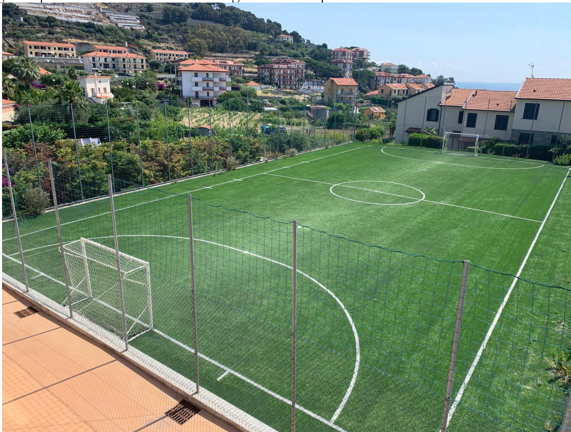
Foto A - Vista generale campo

Si allega alla presente documentazione fotografica dell’impianto: