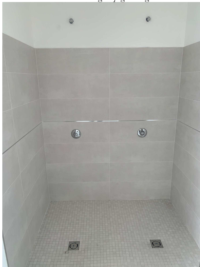
Foto F - Vista dettaglio spogliatoio giocatori - docce