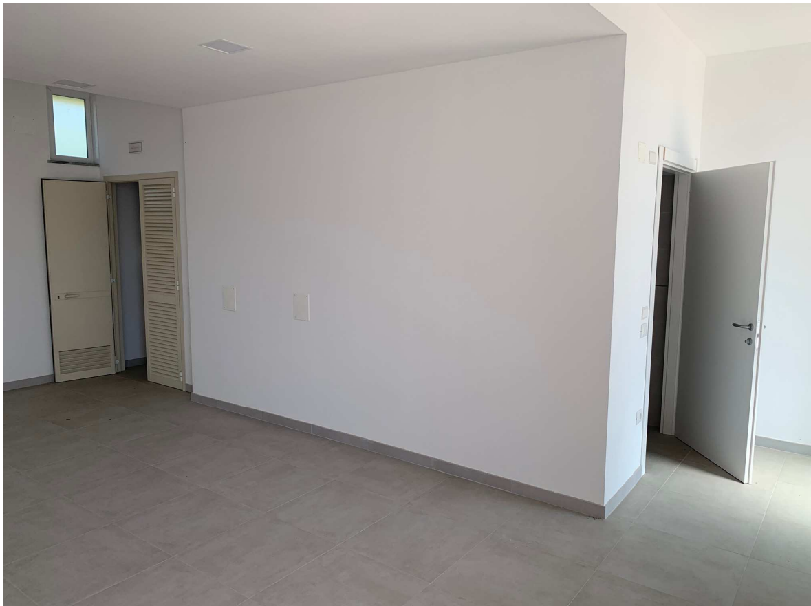
Foto D - Vista dettaglio sala polivalente