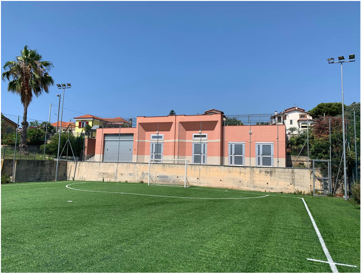
Foto C - Vista generale campo e fabbricato