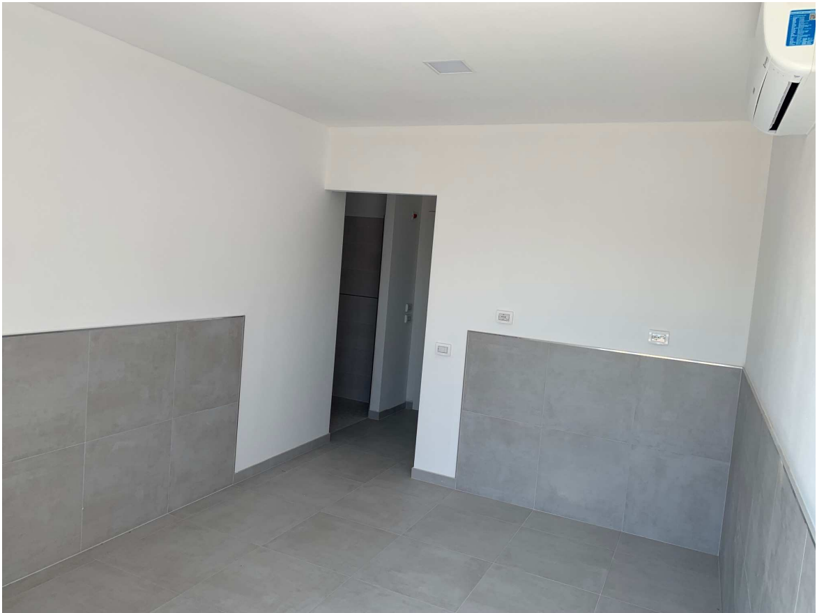
Foto E - Vista dettaglio spogliatoio giocatori