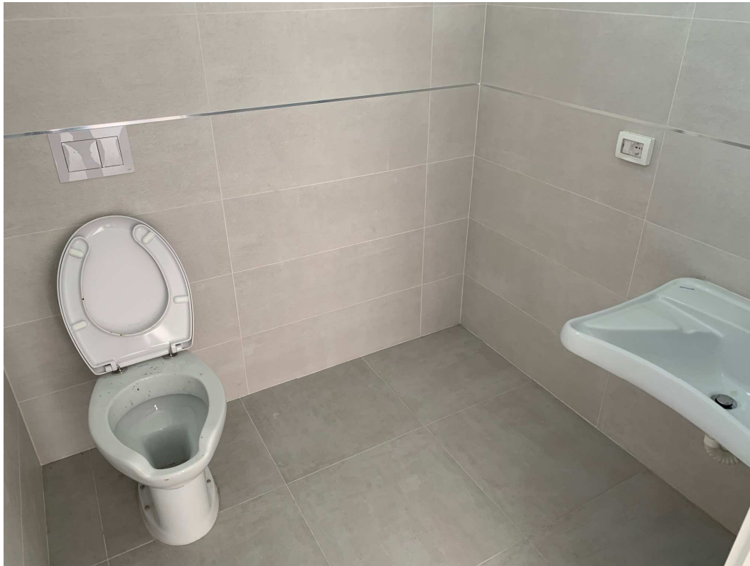
Foto G - Vista dettaglio spogliatoio giocatori - bagno