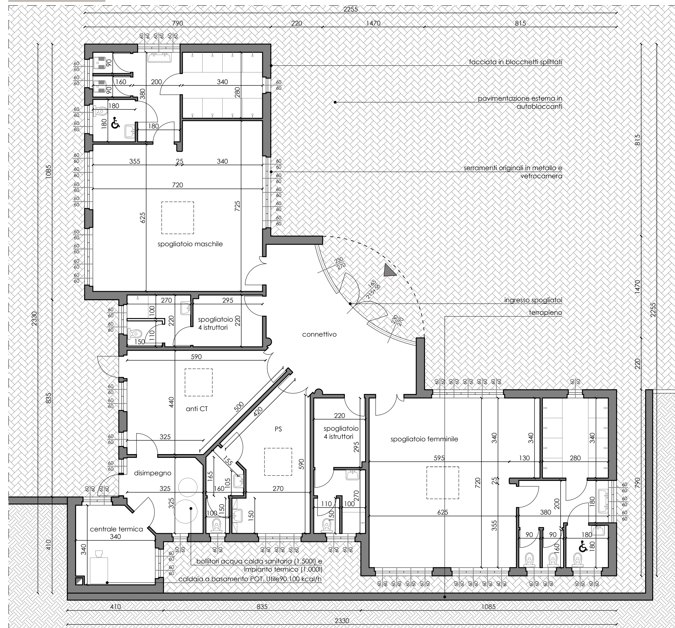
PIANTA PIANO TERRA scala 1:100