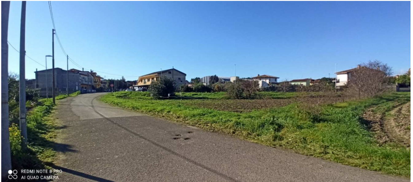
Immagine 3 – Situazione attuale – presa fotografica dalla via Bixio in direzione del centro urbano.