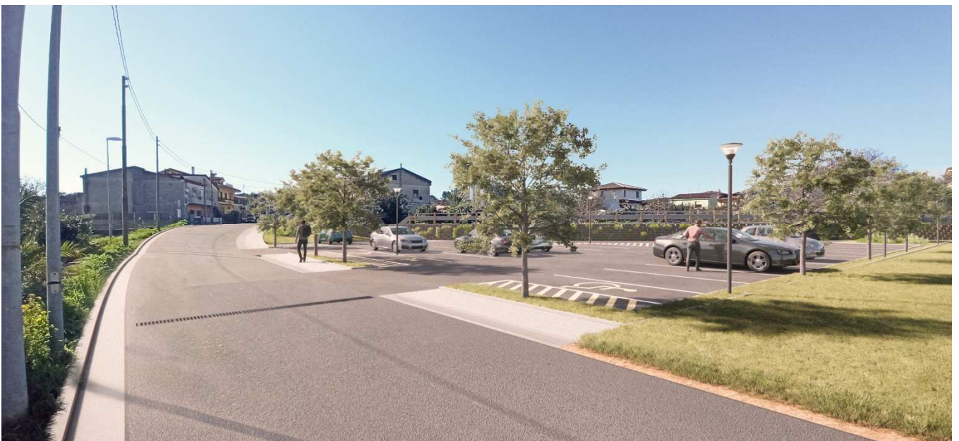
Immagine 4 – Foto inserimento – presa fotografica dalla via Bixio in direzione del centro urbano.