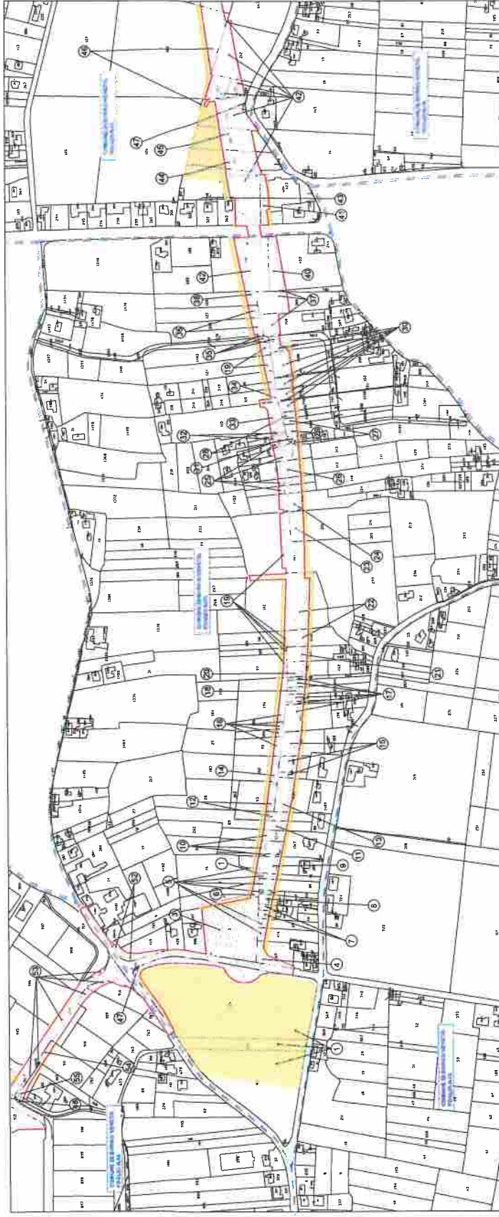
PIANO PARTICELLARE DI ESPROPRIO - PLANIMETRIA CATASTALE - INQUADRAMENTO 03

LEGENDA Area di esproprio Area di esproprio temporanea Area di esproprio temporaneo Linea di esproprio Discontinuità catastale