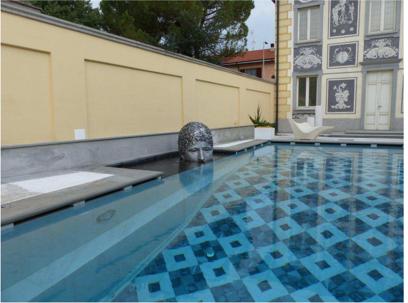
Gabriele Ru Garbolino, "Flowers", Collezione Privata