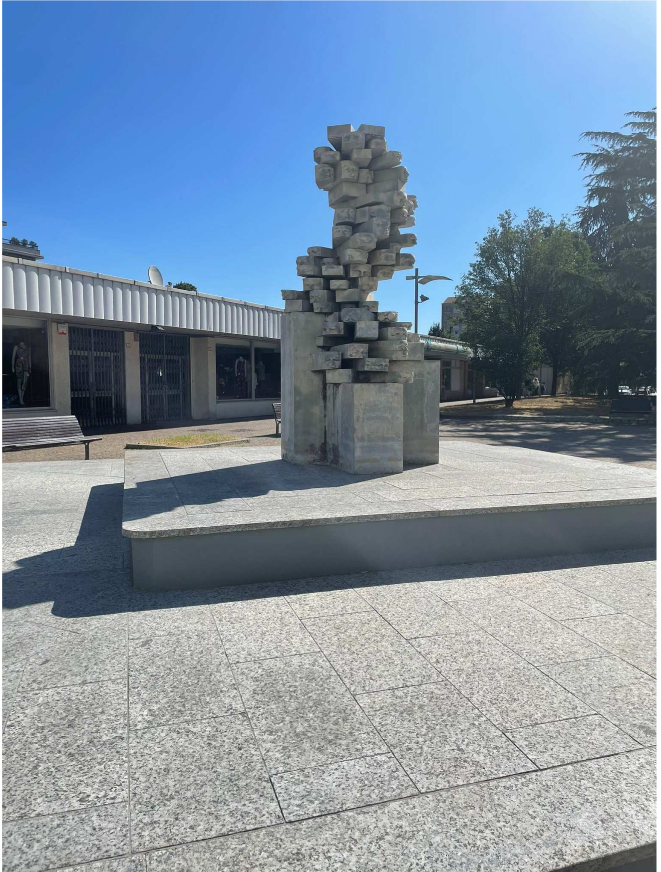
Gabriele Ru Garbolino, monumento ai Caduti, Collegno e opera in mostra, thanks to Galleria Losano Pinerolo