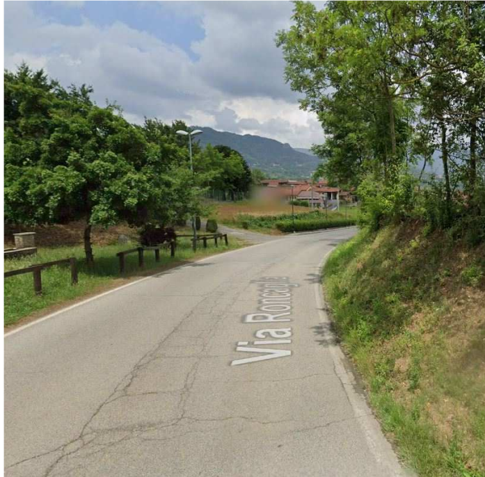
Roletto: Percorso naturalistico in progetto