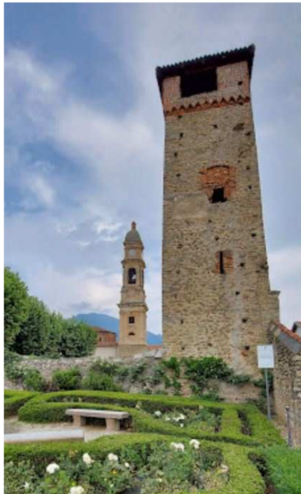
Frossasco: l'antica Torre Medievale