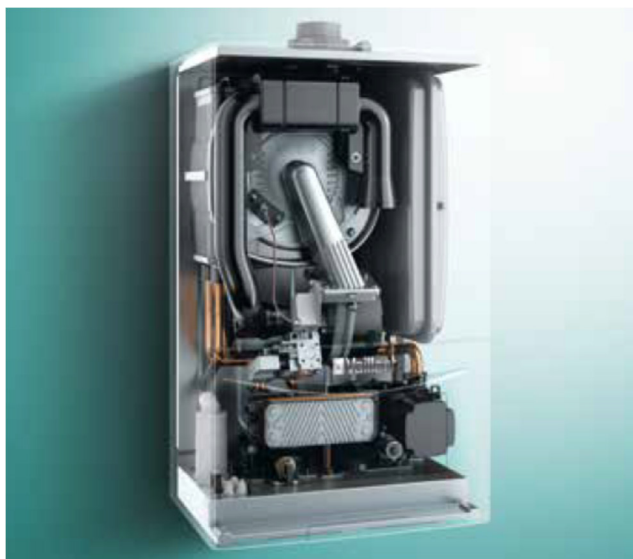
Dati tecnici ecoTEC plus VMW e VMW + sensoROOM connect

Caldaia tipo Vaillant EcoTEC Plus VMW 34 kW per il riscaldamento .