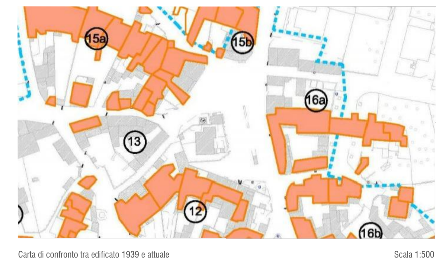
Carta di confronto tra edificato 1939 e attuale