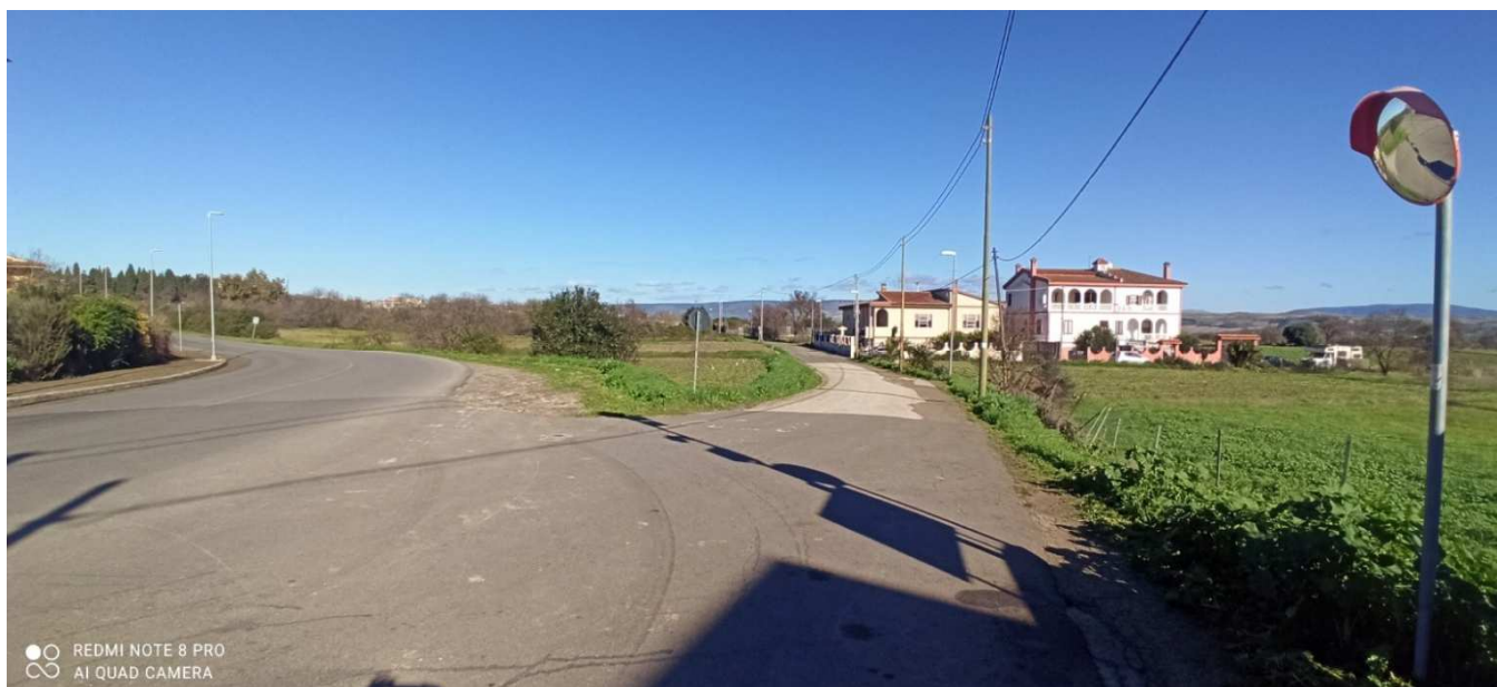
Immagine 1 – Situazione attuale – presa fotografica nell'intersezione a raso tra via Bixio e Via Garibaldi.