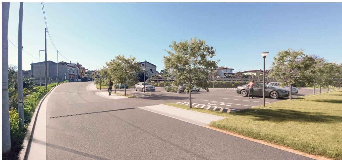
Immagine 4 – Foto inserimento – presa fotografica dalla via Bixio in direzione del centro urbano.