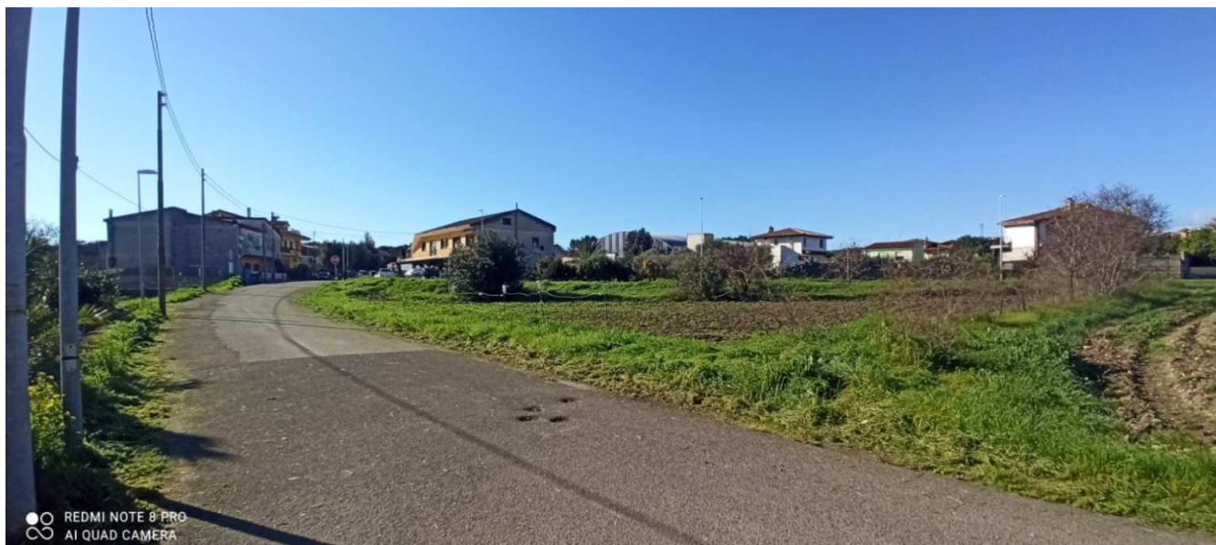
Immagine 3 – Situazione attuale – presa fotografica dalla via Bixio in direzione del centro urbano.