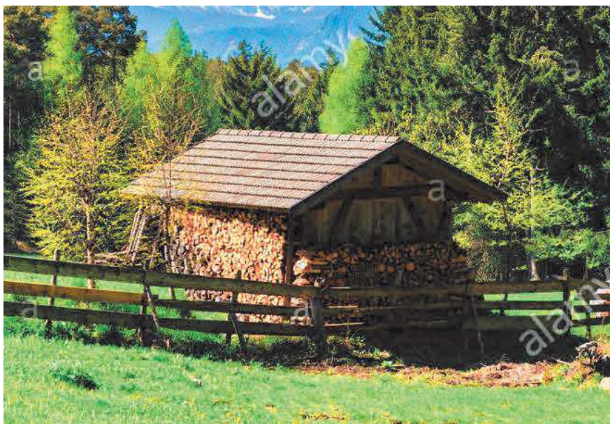
Tipologie esemplificative di manufatti in legno ammessi